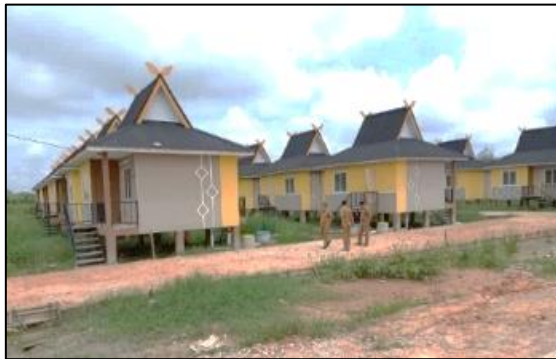
Gambar 3 Rumah Khusus Masyarakat Nelayan

dan panel dalam konstruksi atap (Nasir, Wan Teh. 1996), yang dapat dilihat pada Gambar 3.