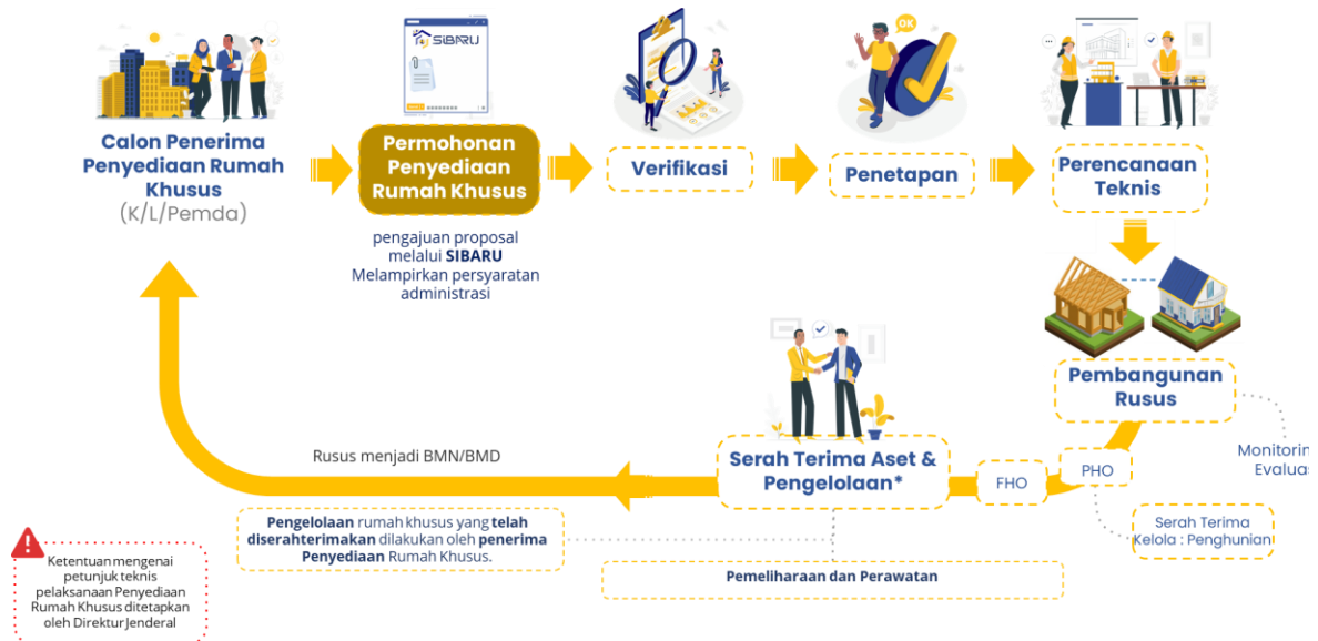
Gambar 4 Mekanisme Penyediaan Rumah Khusus

Melalui aplikasi SIBARU sebagaimana mekanisme di Gambar 4, usulan permohonan dari Pemerintah Daerah atau dari Kementerian/Lembaga lain yang akan diverifikasi administrasi dengan syarat memenuhi Readiness Criteria meliputi kesesuaian dengan RTRW, legalitas lahan harus milik Pemda atau K/L pemohon. Usulan lokasi harus dapat dipastikan tersedia sumber air bersih, jaringan listrik dan akses jalan. Pihak pengusul harus memiliki komitmen untuk menyediakan atau mendukung infrastruktur tersebut.