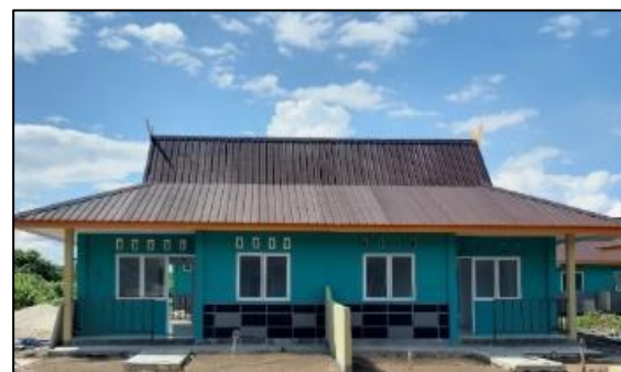
Gambar 2 Rumah Khusus Masyarakat Nelayan

Pembangunan rumah khusus dengan sentuhan kearifan lokal di Kabupaten Siak, Kampung Teluk Batil, Kecamatan Sungai Apit, Provinsi Riau, diselesaikan pada bulan Desember 2019. Rumah khusus sebanyak 25 unit dengan Tipe 28 Kopel dengan bata penuh. Bantuan rumah diperuntukkan untuk relokasi masyarakat nelayan di bantaran Sungai Siak, Kecamatan Sungai Apit dalam rangka peningkatan kualitas hidup melalui Program Rumah Khusus Nelayan. Gaya arsitektur mengadopsi rumah tradisional Riau: Salaso Jatuh Kembar , dengan menggunakan atap limas dengan ornamen pada ujung atap sesuai dengan ciri khas daerah Siak seperti pada Gambar 2.