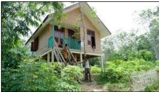
Gambar 1 Rumah Khusus bagi Suku Anak Dalam

diharapkan suku Anak Dalam akan hidup menetap dengan kehidupan yang lebih baik.